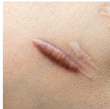
Hypertrófiás, keloidos heg