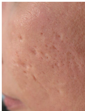
Acnés, atrófiás heg