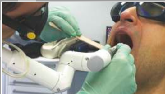
2. lépés: SZÖVETEK ÖSSZEHÚZÁSA